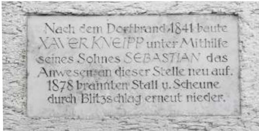
Gedenktafel an Haus Nr. 4 in Stephansried

Ein Jahr nach dem Tod von Kneipp wurde zu seinen Ehren ein Denkmal in Stephansried errichtet.